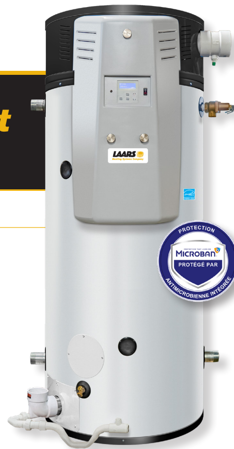
La photo représente le modèle UFT120 0400